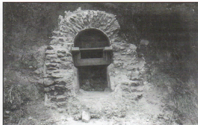
Fig. 1 - Coupe transversale de l'aqueduc, au fond du parking de l'Hôtel Climat, chemin de Gargantua, à Dardilly. Le canal est large de 0,75 m et haut de 1,70 m sous clé.

Il part d'un vallon situé au bas d'Aveize, entre Duerne et Sainte-Foy-l'Argentière, sur le versant occidental des Monts du Lyonnais. L'endroit, particulièrement riche en eau, était bien choisi. En ligne droite il n'est qu'à 26 km de la ville, mais