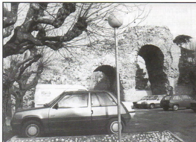
Fig. 3 - Les Massues, à Tassin la Demi Lune. Le monument est visible depuis l'extrémité de la rue des Aqueducs, à Lyon, 5°. Ce rampant marque la fin du siphon.

Le Pré-inventaire a répertorié 170 vestiges, qui sont décrits, repérés avec précision, et pointés dans un atlas de vingt-quatre cartes à grande échelle. Ce recensement est suivi d'une étude technique, architecturale et hydraulique. L'aqueduc