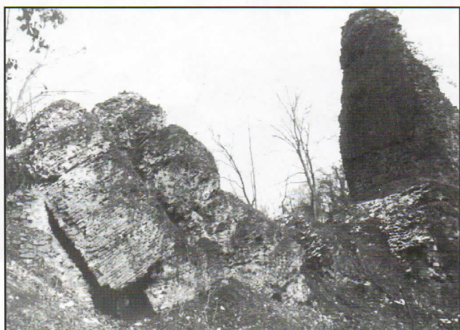
Fig. 2 - Le Pont des Planches, à Ecully. Ecroulé en 1827, classé Monument Historique en 1945. Accessible depuis le parking de la Clinique du Val d'Ouest, chemin de la Vernique. Ce pont portait les tuyaux de plomb du siphon.

il en est séparé par la montagne qu'il faut contourner. A cela s'ajoutent les incessantes sinuosités imposées par le relief.