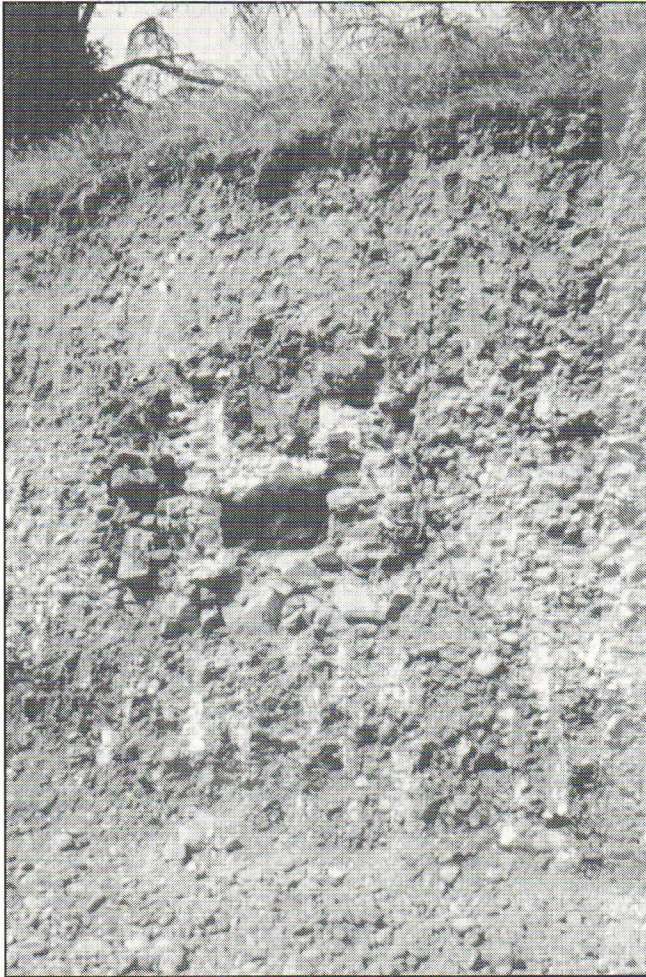
L'aqueduc de l'Yzeron rue Joliot-Curie

L'aqueduc de l'Yzeron est le plus complexe, et aussi le plus mal connu, des quatre aqueducs construits il y a quelque vingt siècles pour la capitale des Gaules.