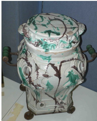
Figure 5 : Poêle à fumigation

sur trois réchauds remplis de charbons ardents, on avait jeté une poignée de parfum doux composé principalement de soufre, benjoin, cannelle, anis vert et myrrhe. Elles restaient soumises à l'action du parfumage le temps de dire un Pater et un Ave , ce qui leur paraissait une éternité en raison des vapeurs sulfureuses qui se dégagent du mélange et les asphyxiaient à moitié. [6]