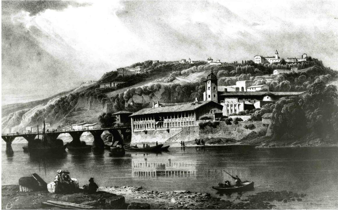
Figure 4 : Hôpital de la Quarantaine par Guindrand, 1835

Une journée à Saint-Laurent était rythmée par les sons de cloche de l'église selon l'ordre dressé par un Commissaire de la Santé. À sept heures avait lieu la prière générale du matin suivie de la distribution de pain et de potage. À dix heures, le repas fait d'une livre de viande et de pain était aussi précédé d'une prière. À dix-sept heures, c'était le souper. Concernant l'approvisionnement alimentaire de l'hôpital et de Fleur-de-Lys, les registres municipaux font état de 744 quintaux et 98 livres de pain délivrés entre le 19 septembre et le 30 octobre 1628 et de 398 quintaux et 110 livres de viande délivrés jusqu'au 20 décembre. [3] La volonté apparente qu'avait le Bureau de Santé de satisfaire au maigre confort des malades ne doit cependant pas nous tromper sur les conditions matérielles réelles dans lesquelles ils se trouvaient. En effet, cette belle organisation ne fut applicable que tant que les malades restaient peu nombreux. Mais après un mois d'épidémie, d'énormes difficultés surgirent. L'économe