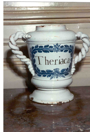
Figure 7 : Vase à thériaque en faïence, début XVIII ème siècle

Les apothicaires représentaient le troisième corps de métier médical au rôle primordial pendant les épidémies de peste. Ils dépendaient du service de la Santé qui envoyait Sieur Marcellin en personne pour contrôler les drogues : « Quand il faudra faire la composition du parfum fort et doux, l'apothicaire l'en advertira afin qu'il se transporte chez luy pour y voir les drogues qui entrent dans la composition desdits parfums, si elles sont bonnes et de qualité requise pour ensuite en faire son rapport au Bureau, et qu'il y délibère de la quantité qu'il en faudra faire ». [8] C'est dans la fameuse confrérie des épiciers et apothicaires de la rue Bourgchanin, dans le logis de la Magdelaine, que se fabriqua en grande solennité dans des vases en étain ou en faïence ( Figure 7 ), la célèbre thériaque utilisée pendant l'épidémie. [6]