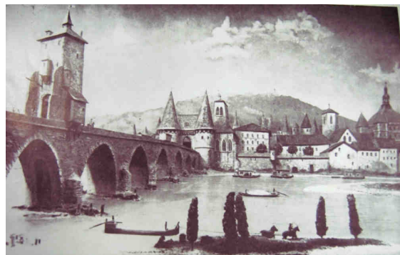
Figure 1 : Pont du Rhône

En temps d'épidémie, les portes de la ville étaient fermées. Toute personne désirant entrer à Lyon devait montrer aux officiers un certificat sanitaire appelé bullette, attestant qu'elle ne venait pas d'un endroit contaminé, qu'elle n'en avait pas traversé. Ce contrôle était souvent effectué dans la guérite du pont du Rhône puisque l'unique route d'Italie ou de Savoie débouchait sur ce pont ( Figure 1 , actuel pont de la Guillotière).