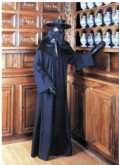
Figure 6 : Habit des médecins et autres personnes qui visitent les pestiférés

cette insinuation ne repose sur aucun document connu. [17] Quelque soit sa véritable origine, le costume ( Figure 6 ) [18] se composait toujours d'une chemisette de peau rentrant dans des culottes que venaient recouvrir de hautes bottes. Une longue robe de maroquin de levant, avec des manches serrées au poignet, recouvrait le tout. Les mains étaient en plus protégées par des gants de cuir à crispin. [6] La tête enfin était enfermée dans une sorte de casque avec de faux yeux de cristal et un long nez « en forme de bec, rempli de parfums et oint intérieurement de matières balsamiques ». [18] Ce bec conférait d'ailleurs souvent au personnel médical le surnom de corbeau, sans aucune allusion aux croque-morts qui ramassaient les cadavres dans les rues pour les jeter à la fosse.